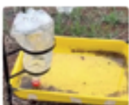
Bandeja Amarela Garrafa PET