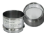
Peneira 3x2 10 - 2,00 mm 60 - 0,250 mm